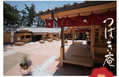
ゆっくりとくつろげる空間