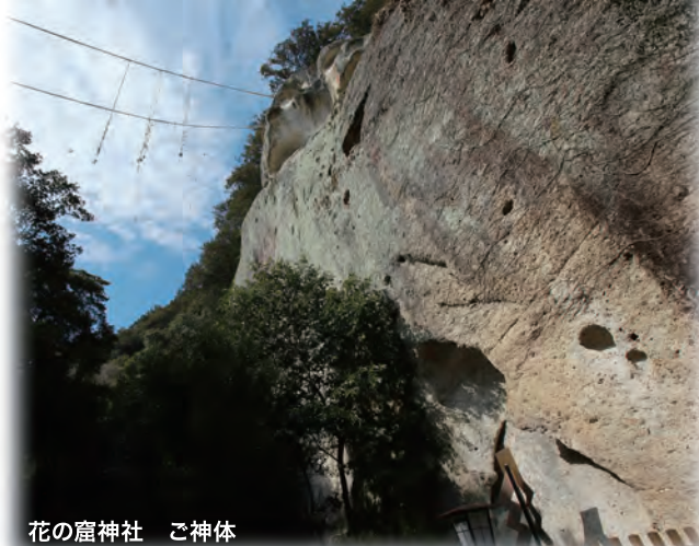
花の窟神社 ご神体

花の窟は720年(奈良時代)に記された日本最初の歴史書『日本書紀』の神代第一で「国産みの舞台」として登場しています。この地は熊野三山信仰に先立つ古代からの聖地「イザナミノミコトの墓陵」として重要な意味を持っており、まさに日本人のルーツといえる場所です。朝廷より花の窟に錦の御幡をつかわしたことが書かれています。日本書紀に記されている事柄そのままに、今も毎年2月2日と10月2日には、例大祭(お綱かけ神事)が行われ、多くの方が参拝に訪れます。